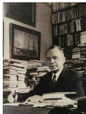
А. Л. Чижевский за работой

И в лагере он также занимался наукой, поэзией и живописью – написал более 100 стихотворений, создал кабинет аэроионификации, занимался электрическими проблемами крови.