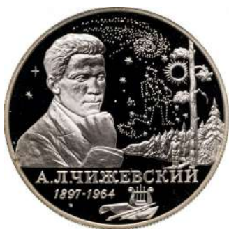
Монета номиналом 2 рубля, выпущенная к 100-летию Александра Чижевского

В последние годы жизни работал над мемуарами «На берегу Вселенной». Воспоминания о К. Э. Циолковском». В 1960-х г. несколько раз бывал в Калуге у дочери Циолковского – Марии Константиновны Циолковской-Костиной, вел с ней переписку.