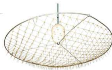
«Люстра Чижевского» - прибор для ионизации воздуха

Ещё во время посещения лекций в Московском археологическом институте в 1915 году параллельно занимался исследованиями в области гелиобиологии (влияние циклов активности Солнца на явления в биосфере и на социально-исторические процессы), с 1918 года в течение 3 лет ставил первые опыты по воздействию отрицательно ионизированного воздуха на живые организмы ( аэроионификация – проблема искусственного создания внутри жилых помещений такого электрического режима воздуха, которым характеризуется воздух лучших местностей, благотворно влияющих на организм человека с помощью ионизаторов воздуха). Чижевский утверждал, что положительно заряженные ионы воздуха негативно влияют на живые организмы, а отрицательно заряженные оказывают благотворное действие.