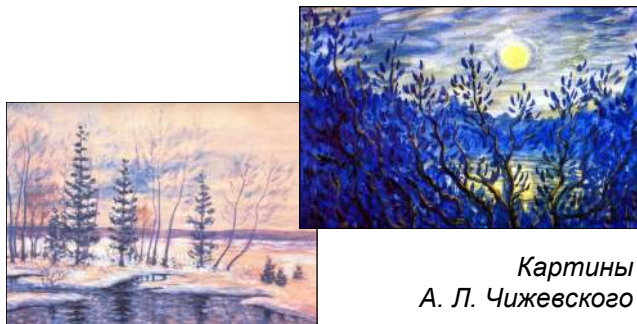
Картины А. Л. Чижевского

В общей сложности он создал около 2000 живописных произведений (в основном пейзажи). Большинство из сохранившихся работ (около 300) – акварели 1940–1950-х годов. Все выставки художественных произведений учёного, в том числе и персональные, были посмертными и проходили в Москве и Подмосковье, Караганде, Калуге.